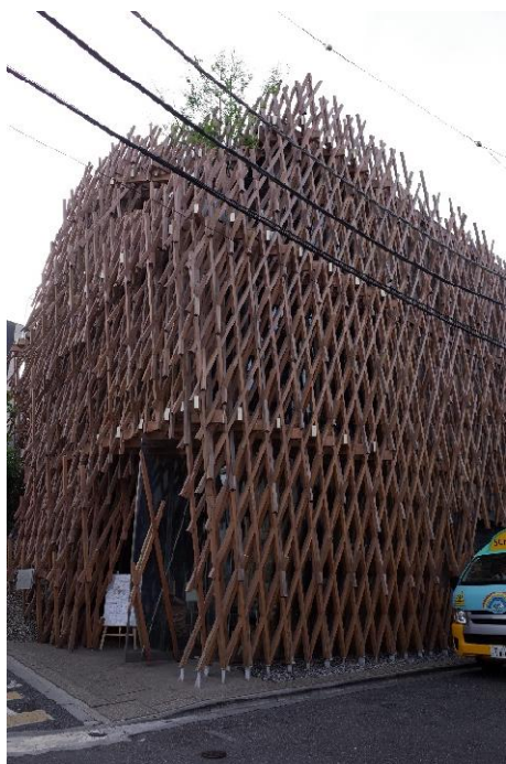
サニーヒルズ青山 設計：隈研吾

木造と鉄骨造の混合造3階建の菓子メーカー店舗。地獄組と言われる木造部分は、一見外部との緩衝材となる化粧材に見えるが、構造体を兼ねている。奥側が鉄骨による柱、梁組、道路側が地獄組の木造による柱となっている。