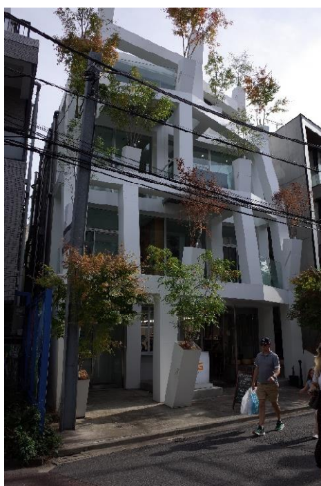
表参道ブランチーズ 設計：藤本壮介

1階で菓子を購入すると2階のスペースで試食が出来る。2階飲食スペースでは地獄組越しに光が入る。木造部分を構造体とした意欲的設計だと思う。